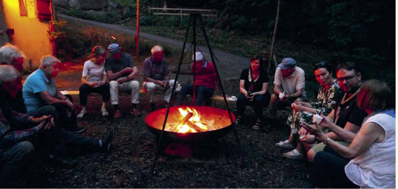
An ein Foto wurde erst gedacht, als es schon dunkel war.