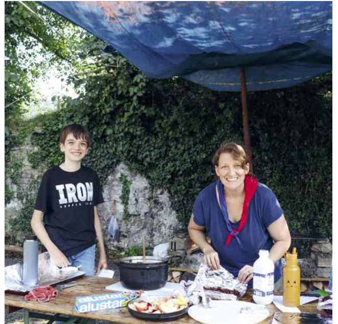
Man hat sich um die Arbeitseinsätze in der selbstgebauten Küche gestritten.