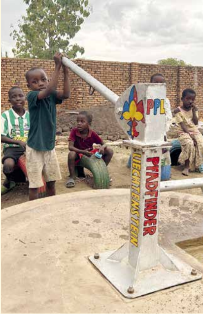
Den Brunnen auf dem Spielplatz in Ifakara ziert das PPL-Logo.