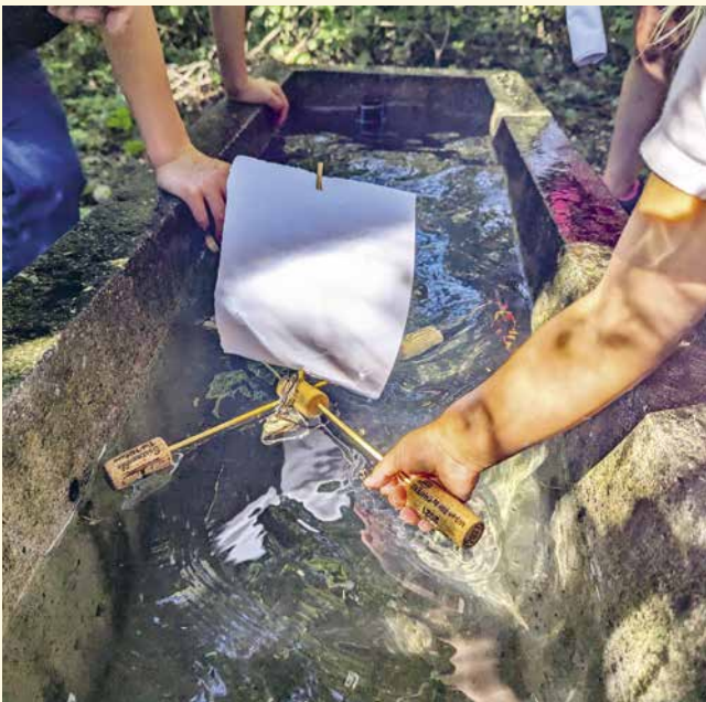
In Triesen stach man mit den gebastelten Papierböthen direkt in See.