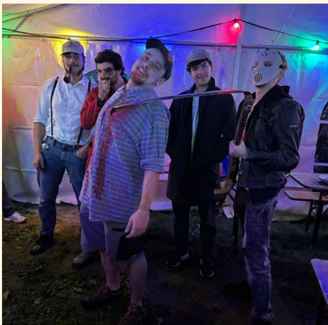
Die Siegerpatrouille «Asesinato» aus Vaduz.