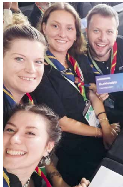
Einer der Höhepunkte in ihrer bisherigen Pfadi-Karriere war die Weltkonferenz in Kairo.