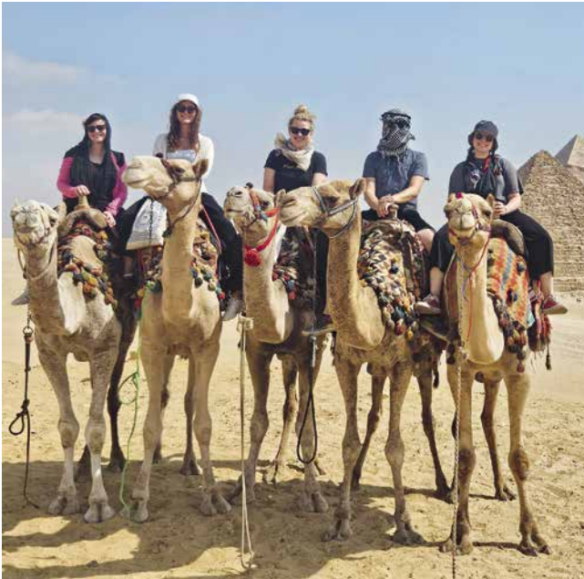
Die Liechtensteiner Delegation gönnte sich einen Kamelritt durch die Wüste.