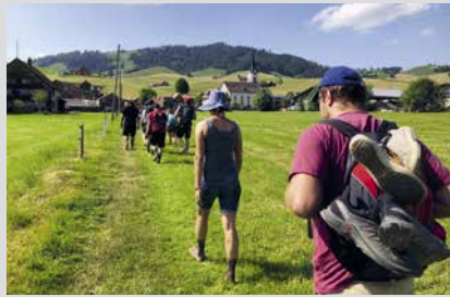
8. Februar 2025, Samstag Landesanlass 3. und 4. Stufe