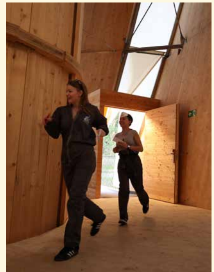
Sportlich und mathematisch herausgefordert wurden die Patrouillen im Turm auf Dux.