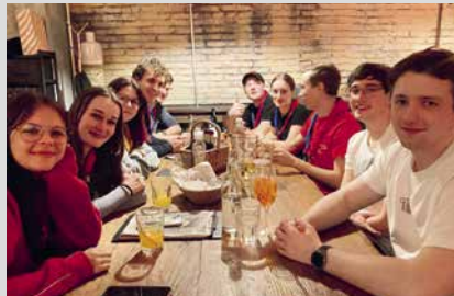
15. Februar 2025, Samstag PPL-Leiterausflug