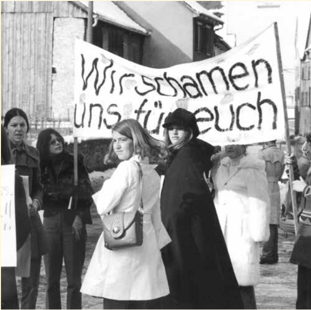
Streikende nach der ersten erfolglosen Abstimmung 1971.