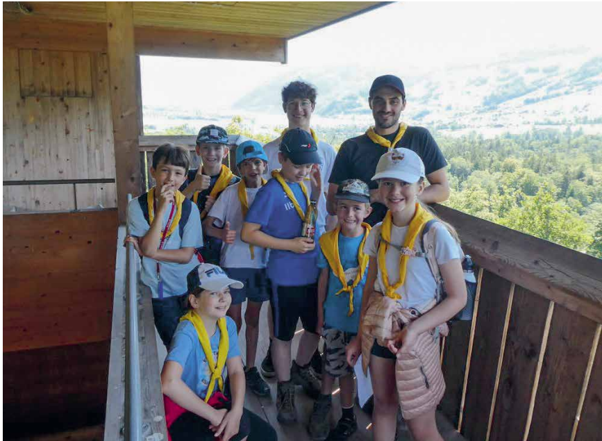
Im Tierpark bot der Aussichtsturm einen guten Überblick.