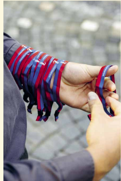
Die Pfadi halfen dabei, die Einlassbändchen zu verteilen.