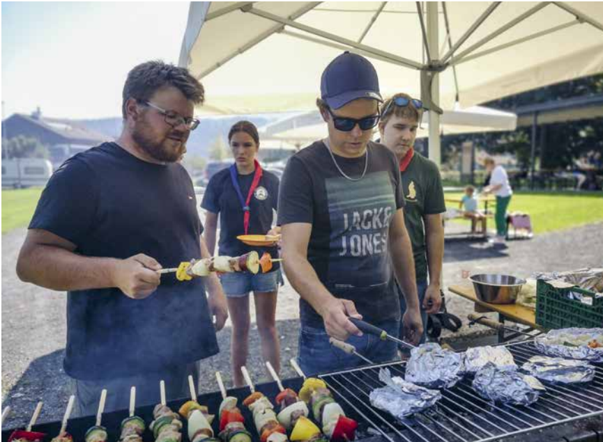
Der Grill war am Mittag in vollem Betrieb.