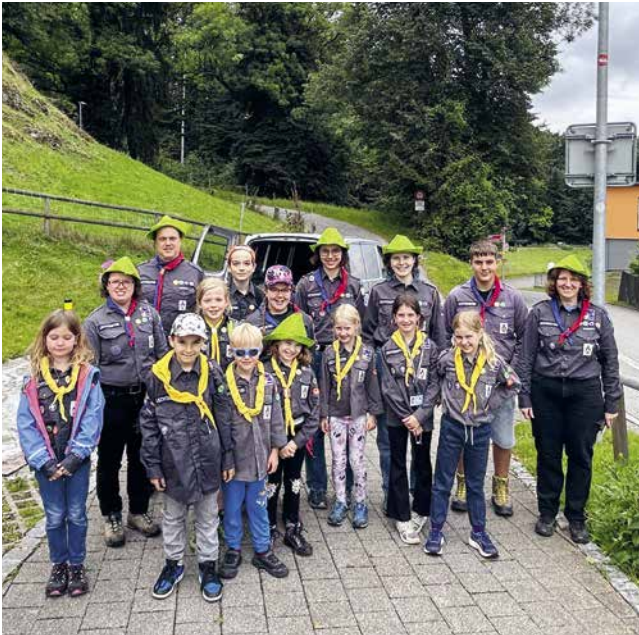
Lagerstart mit dem Motto Robin Hood.