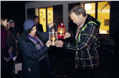
18. Dezember 2024, Mittwoch Friedenslicht