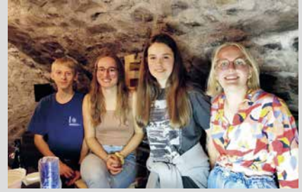
21. Februar 2025, Freitag Beizle (Abt. Ruggell)