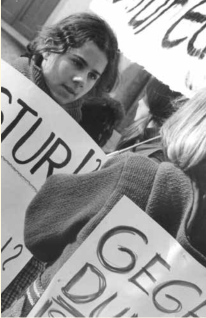
Bis zur Einführung des Frauenstimmrechts wurden mehrere Streiks durchgeführt.