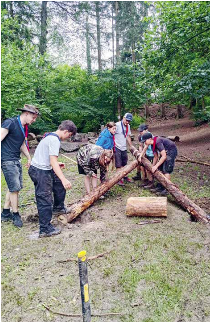
Die Pfadiküche wurde unter schlammigen Bedingungen gebaut.