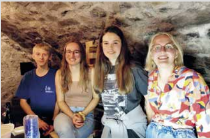
6. Dezember 2024, Freitag Beizle (Abt. Mauren)