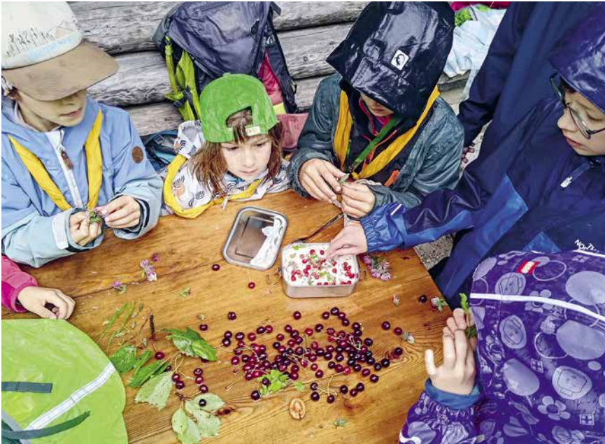
Die BiWö haben ihre Snacks mit den gesammelten Früchten und Kräutern verfeinert.