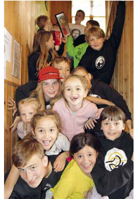
Im Pfadiheim ist es nicht so eng, wie es auf diesem Foto aussieht.