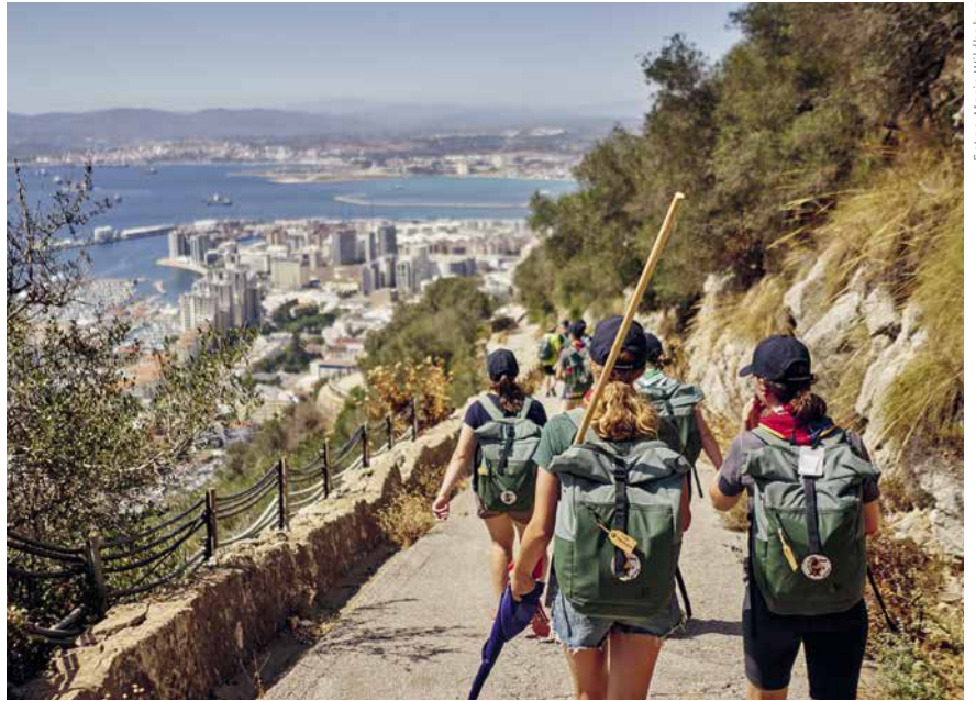
Die 110 Teilnehmenden erkundeten einen Grossteil Gibraltars zu Fuss.