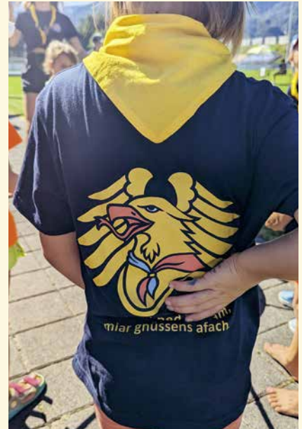
Der Dresscode für den Schnuppertag ist das jeweilige Abteilungsshirt.