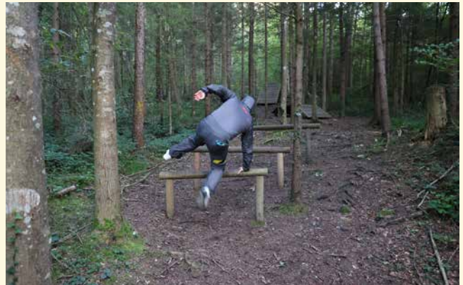
Nach diesem sportlichen Posten mussten sich erst einmal alle erholen.