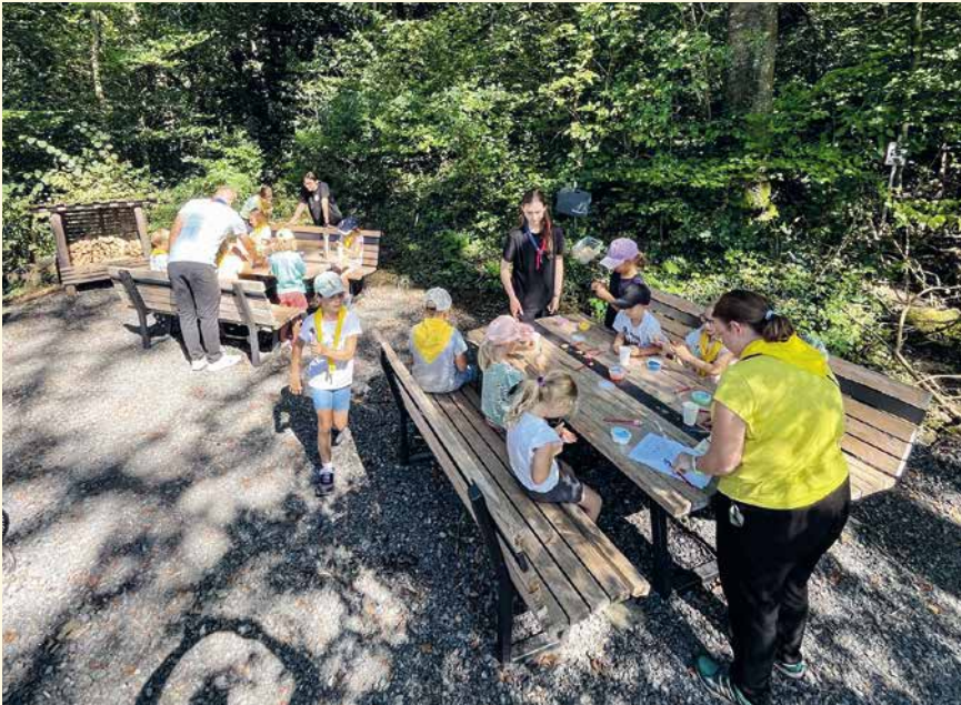
Die Abteilungen Gamprin und Schellenberg trafen sich bei der Feuerstelle «Kratzera».