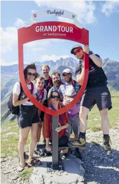
Das PPL-Ausbildungsteam auf dem Pizolgipfel.