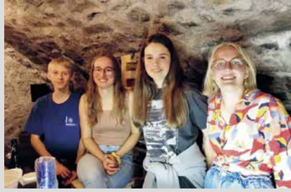
17. Januar 2025, Freitag Beizle (Abt. Schaan/Planken)