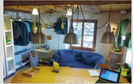
28. März 2025, Freitag Scout Shop