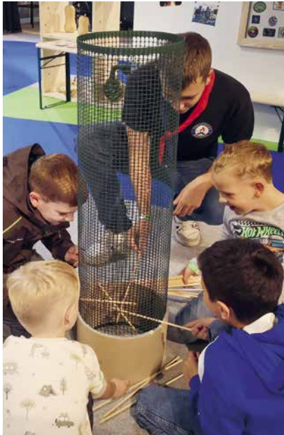
Eines der Spiele im Angebot war eine Variation von «Affenalarm».