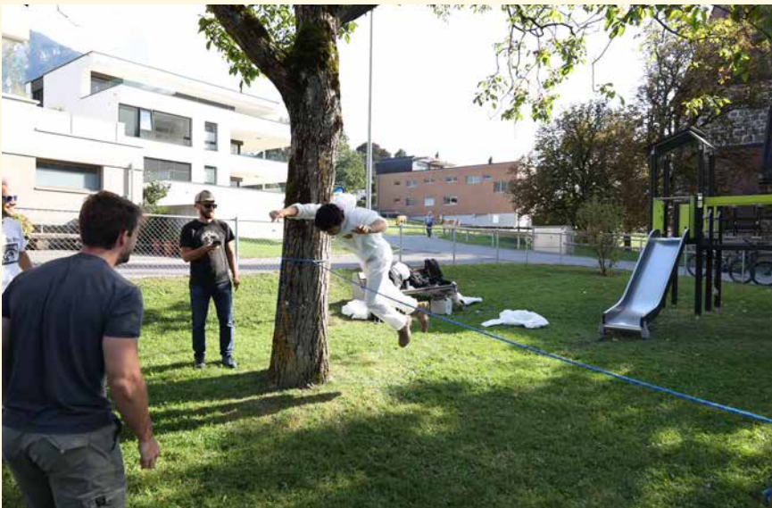
Gewagte Sprünge bescherten reichlich Action.