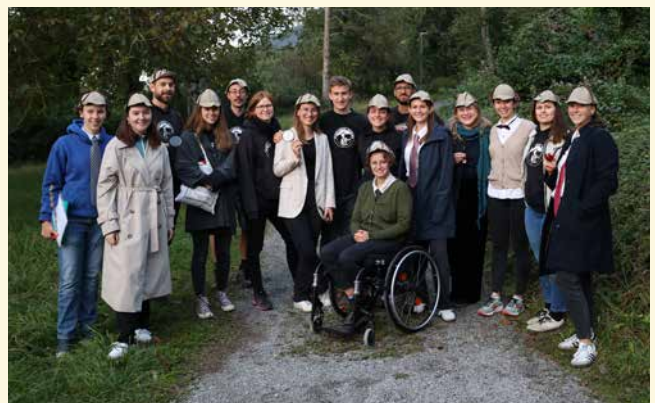
Das Helferteam der Abteilung Schaan/Planken (nicht vollständig).