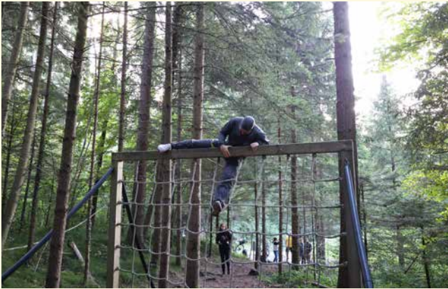
Um den Schmuggelposten zu bestehen, mussten einige Hindernisse überwunden werden.