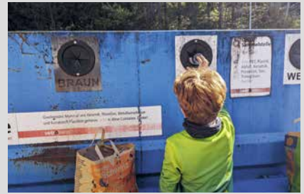
29. März 2025, Samstag Deponie-Café