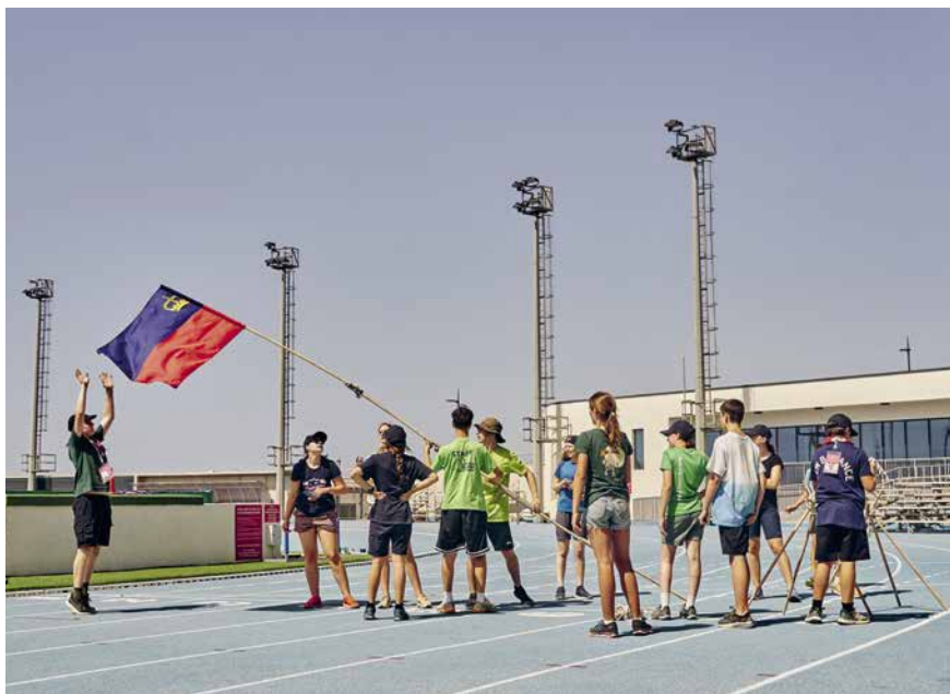
Die Olympiade im Lathbury Sports Centre entschied die liechtensteinische Delegation für sich.