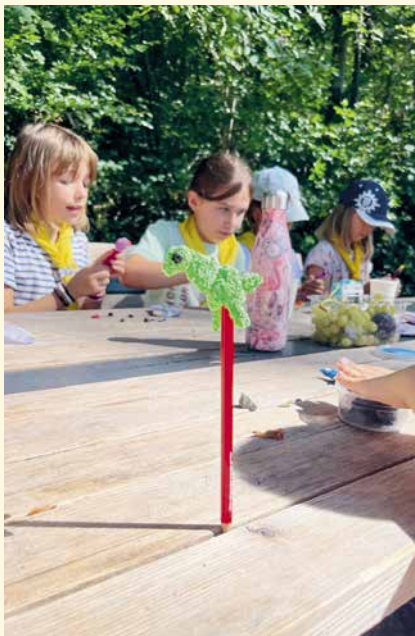
Fast bei allen Schnuppertagen wurden schöne Erinnerungen gebastelt.