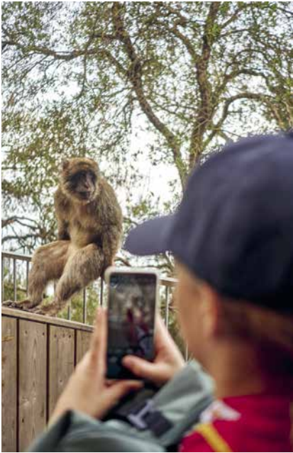
Berberaffen lauerten gerne am Wegrand, um einem das Hab und Gut streitig zu machen.