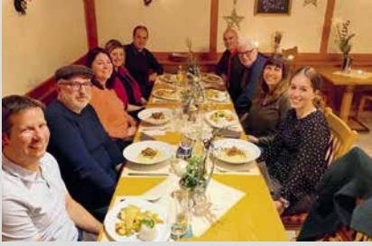
9. November 2024, Samstag Funktionärsessen