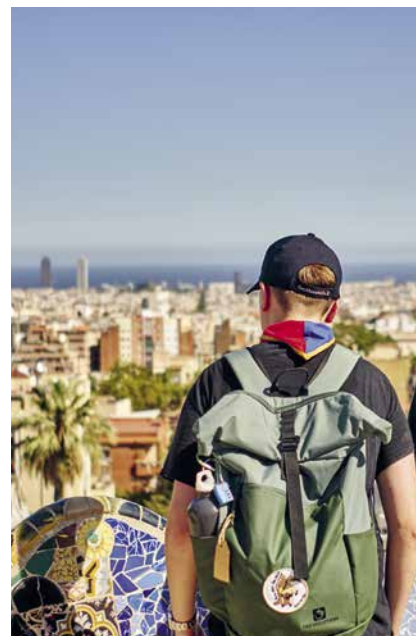
Dir Vorreise führte die Delegation durch mehrere Grossstädte der Iberischen Halbinsel. Hier: Barcelona.

Luftpistolen beziehungsweise mit Pfeil und Bogen schiessen. Im Zentrum stand aber klar die Gemeinschaft. Für viele Jugendliche war es die erste Erfahrung in einem internationalen Umfeld und doch schlossen viele von ihnen neue Freundschaften. Sie tauschten Pins, Abzeichen oder ihre «Tüchle» und lernten andere Sitten kennen. Etwas, das im kleinen Rahmen besser funktioniert als an einer Grossveranstaltung. Genau dieser Gedanke war der Grund, warum das EMJ vor gut 15 Jahren ins Leben gerufen wurde. Denn an einem World Scout Jamboree mit mehreren Zehntausend Teilnehmenden gehen Kleinstaaten gerne einmal unter.