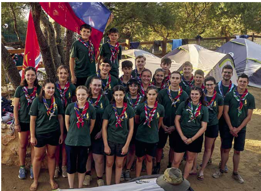
23 Pfadfinderinnen und Pfadfinder aus Ruggell nahmen stellvertretend für Liechtenstein am Kleinstaaten-Jamboree teil.