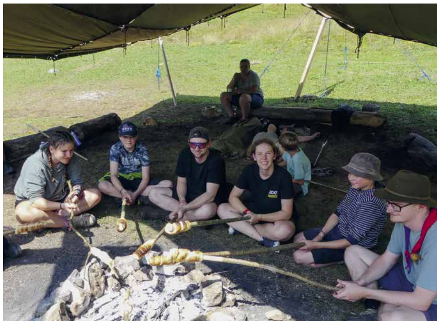
Im Pfadi-Sommerlager wird immer über offenem Feuer gekocht.