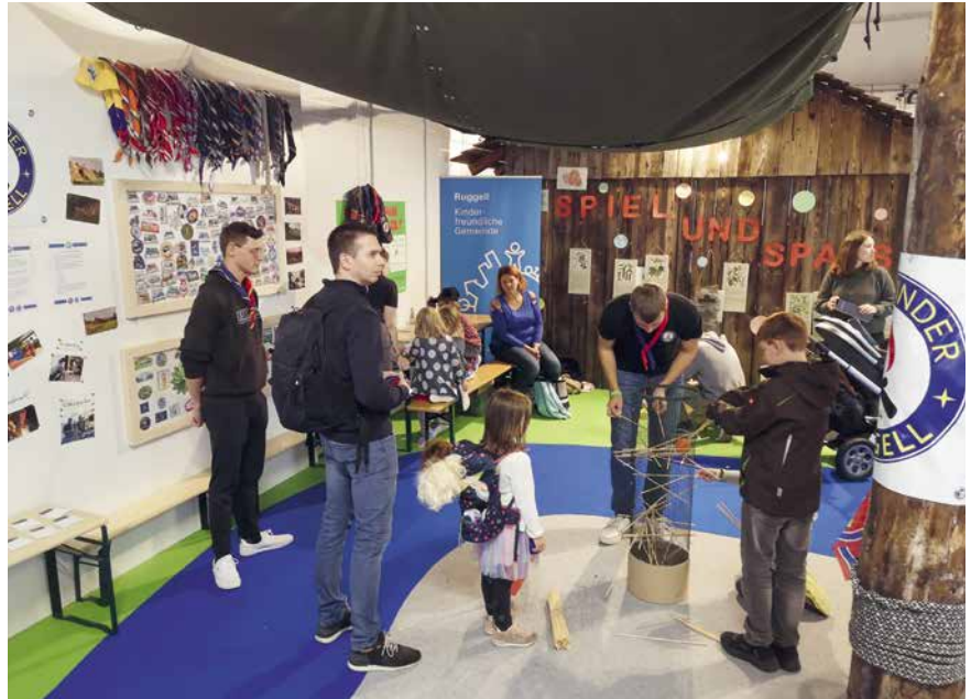
Der Besucherandrang am 14. September war idealerweise gross.