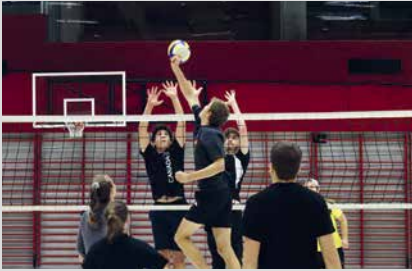
23. November 2024, Samstag Hallenturnier 3. und 4. Stufe