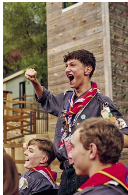
Das Euro-Mini-Jam bot den 13- bis 16-Jährigen die ideale Gelegenheit internationale Pfadi-Luft zu schnuppern.