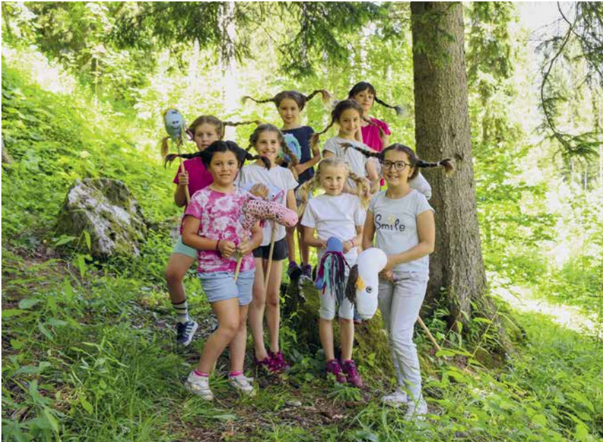
Pippi Langstrumpf war im BiWö-Sommerlager gleich mehrfach vertreten.