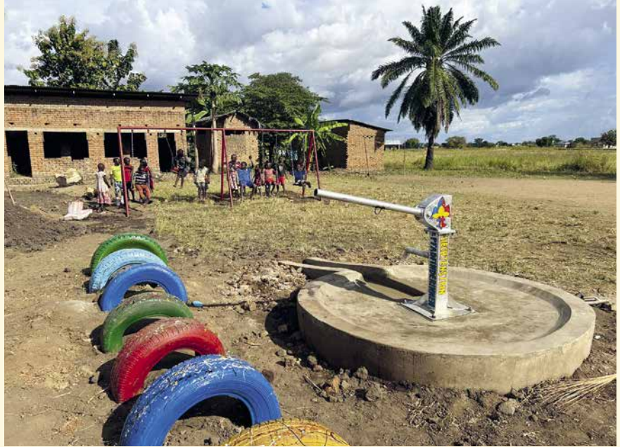
Der Brunnen befindet sich auf einem Spielplatz.

reichen Brunnenbauprojekten in Tansania viele Erfahrungen gemacht hat, wählten sie einen passenden Standort, wo der Brunnen errichtet werden soll. Das Gelände einer angehenden Kindertagesstätte eignete sich hervorragend. Dieses wurde während des Aufenthaltes durch weitere Spendengelder mit einem Spielplatz ergänzt. Seit dem Sommer 2024 bietet die Kita Kleinkindern eine abwechslungsreiche Spielzeit und das Aussenareal mitsamt dem Pumpbrunnen ist für alle öffentlich zugänglich.