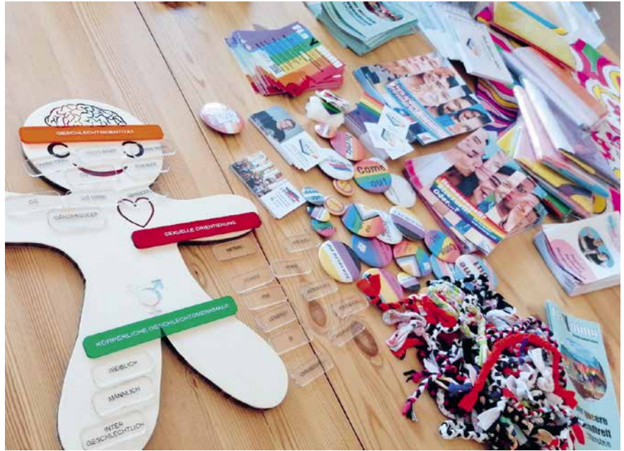
In die Themenkisten wird reichlich Lern- und Spielmaterial gepackt.

beschäftigt, die ersten drei Kisten fertigzustellen. Wir starten mit den Themen Nachhaltigkeit, «Safe from Harm» (Jugendschutz) und Queer-Scouting – doch es sind noch weitere Kisten geplant wie zum Beispiel eine Inklusionskiste und eine zum sicheren Online-Surfen. Alle Themenkisten sollen die Traditionen der Pfadi fördern, aber diese gleichzeitig in die heutige übertragen.