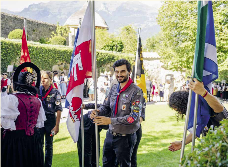
Das Ziel ist, dass die Gemeindefahnen jeweils von einem Pfadi, der dort wohnt, getragen wird.