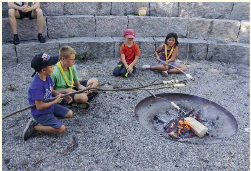
Wahrlich eine Pfadi-Spezialität: Schlangenbrot.