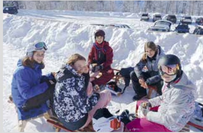
18. Januar 2025, Samstag Landesanlass 2. Stufe