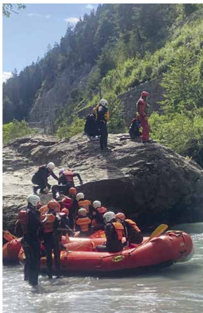
Einer der Höhepunkte des Pfadi-Sommerlagers: River Rafting in der Rheinschlucht.