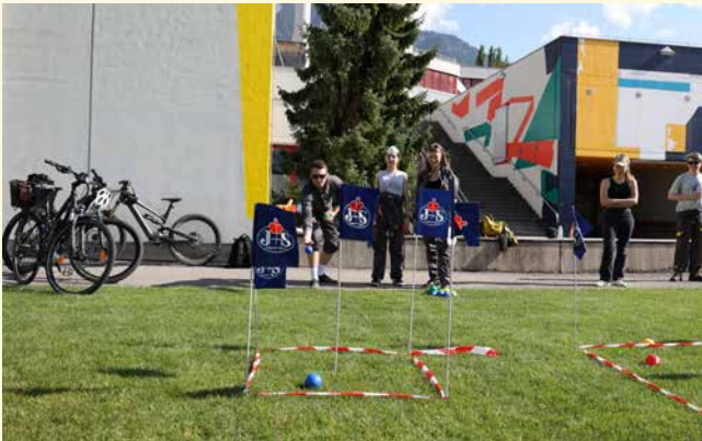
Bei einem der Posten war Zielgenauigkeit und Treffsicherheit gefragt.