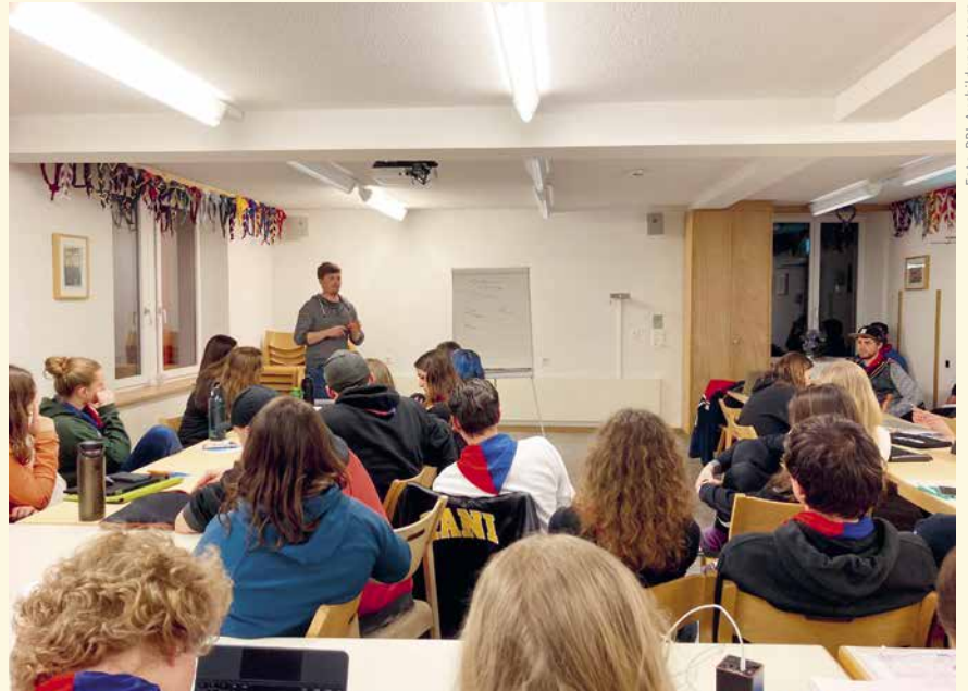
Der Ausflug war auch eine Belohnung für die erfolgreiche PPL-Ausbildungswoche 2023 in Kandersteg.