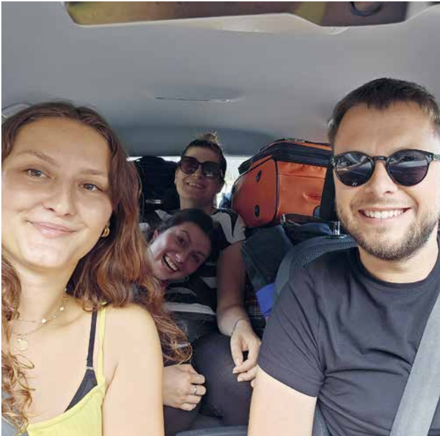
So fing alles an: Die Hinfahrt von Liechtenstein nach München, bevor das Auto nicht mehr startete.