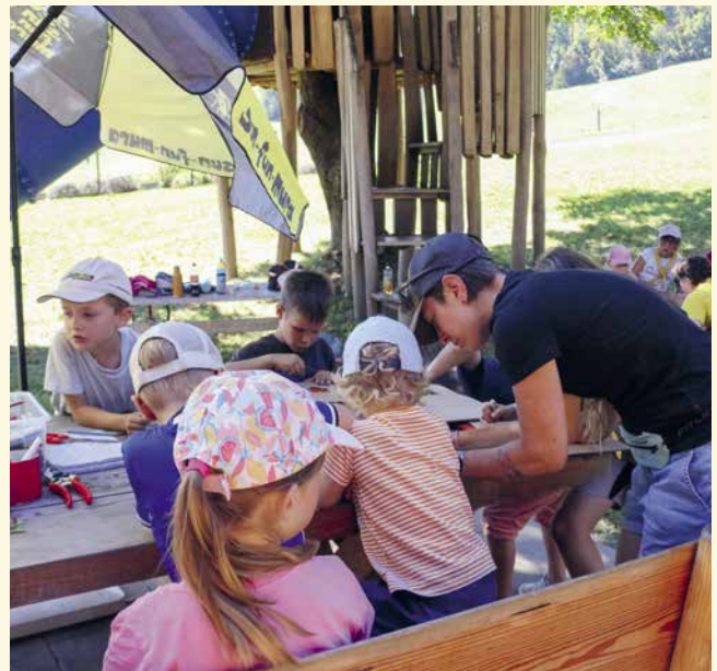
Auch die Eltern, unter denen sich einige ehemalige Mitglieder befanden, liessen sich den Bastelspass nicht entgehen.