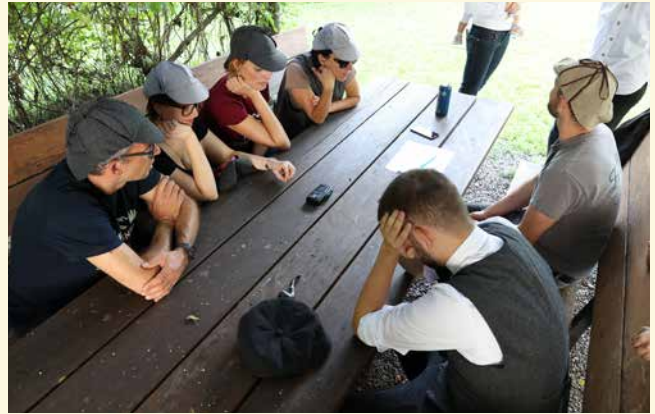
Ohne Köpfchen und Ermittlungsgeschick war man bei den Posten verloren.