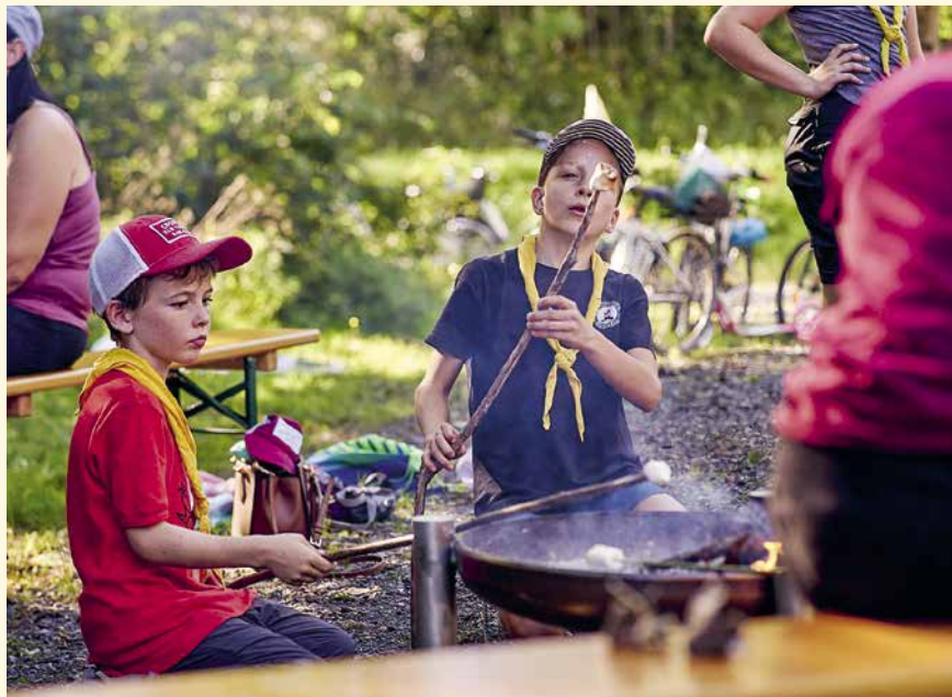
In Ruggell snackten die Teilnehmenden gebratene Marshmallows.