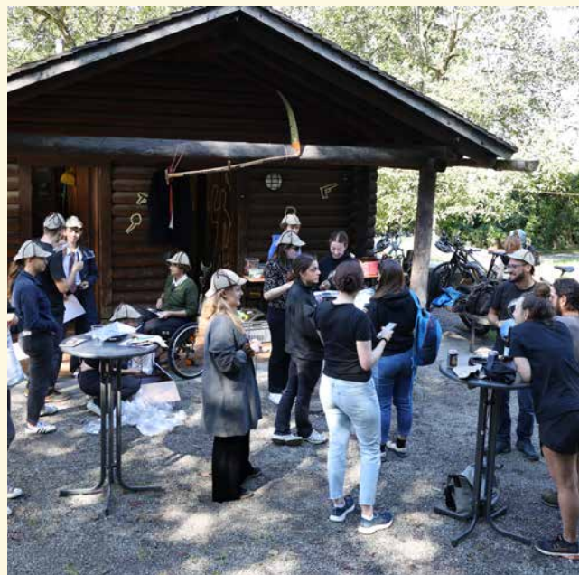
Nach den Vorbereitungen warteten die Schaaner auf ihre Gäste.