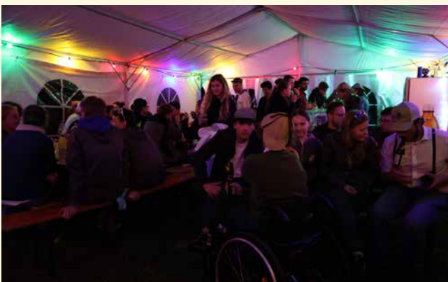
Die Sägässä klang Abends im Festzelt oder am Lagerfeuer aus.