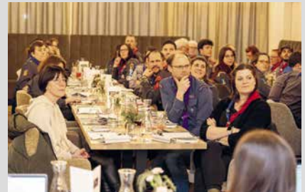
5. April 2025, Samstag Delegiertenversammlung in Schaan