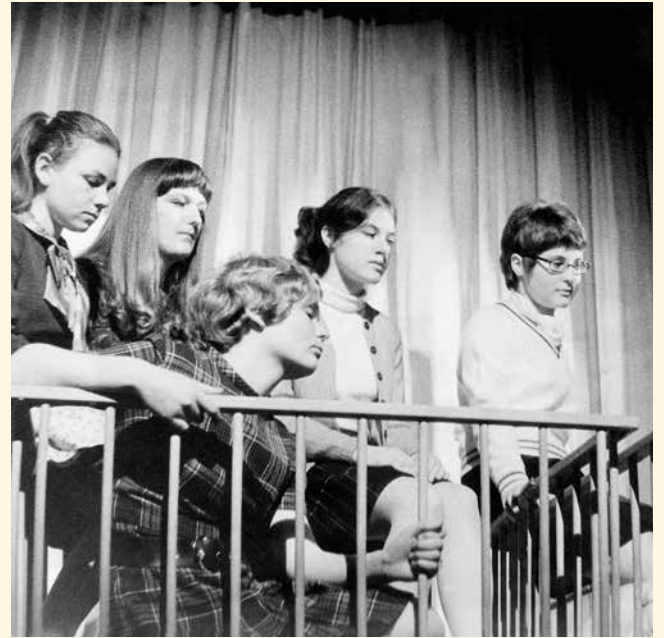
Aufnahme vom Stück «Die Frauen im Laufgitter», aufgeführt im Jahr 1969 in Vaduz.