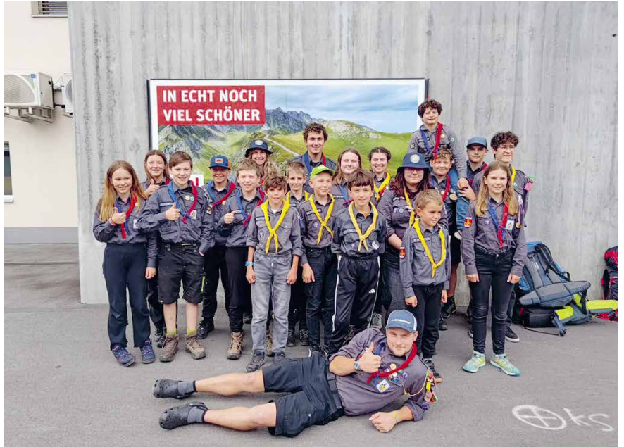
Gruppenfoto: Die Teilnehmenden der drei Abteilungen Balzers, Ruggell und Vaduz haben gemeinsam eine unvergessliche Woche erlebt.