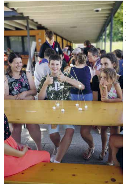
Die Bautechniken variierten stark, diese Gruppe war erfolgreich.