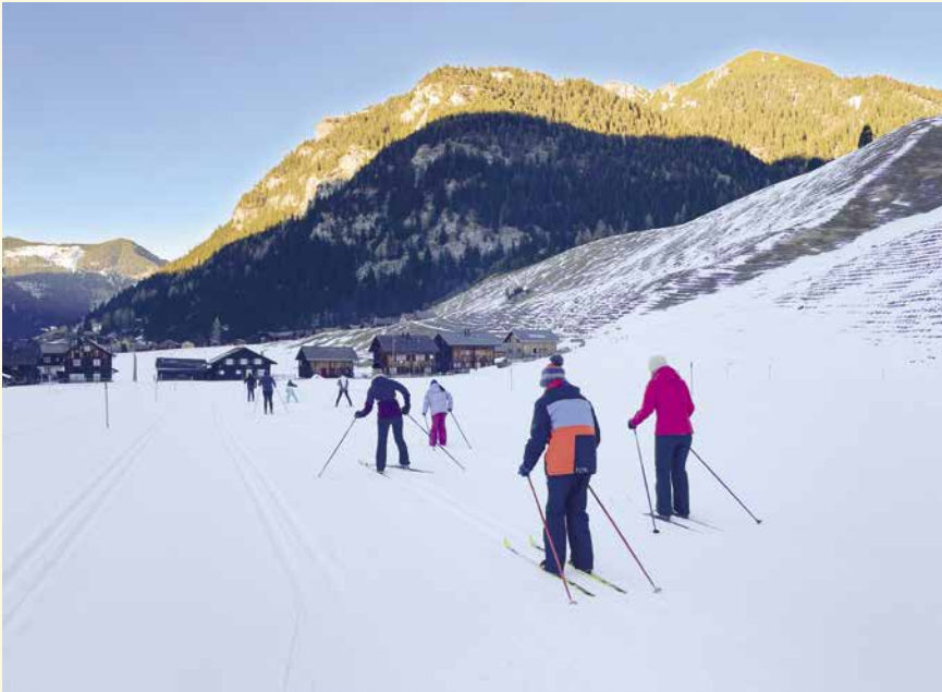
Es zeigte sich rasch, dass Langlaufen schwieriger ist, als viele gedacht haben.