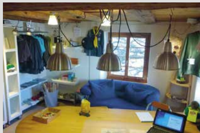
29. August 2025, Freitag Scout Shop