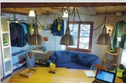
4. Juli 2025, Freitag Scout Shop