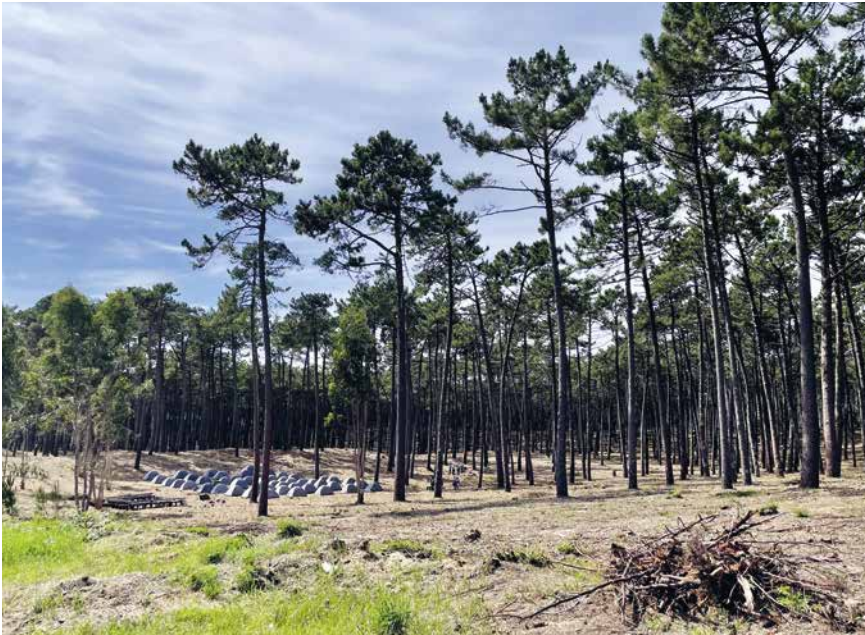
Blick auf den Lagerplatz in Ovar.