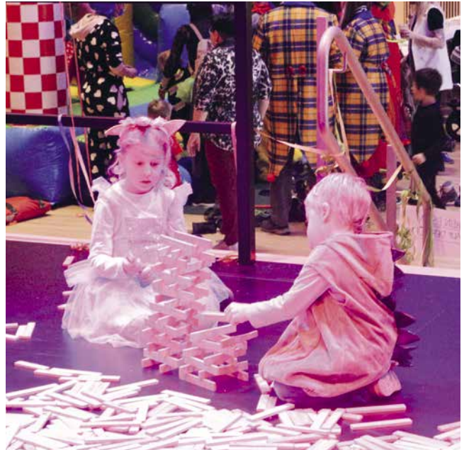
Auf der Bühne war das eine oder andere Architekturtaent zu erkennen.