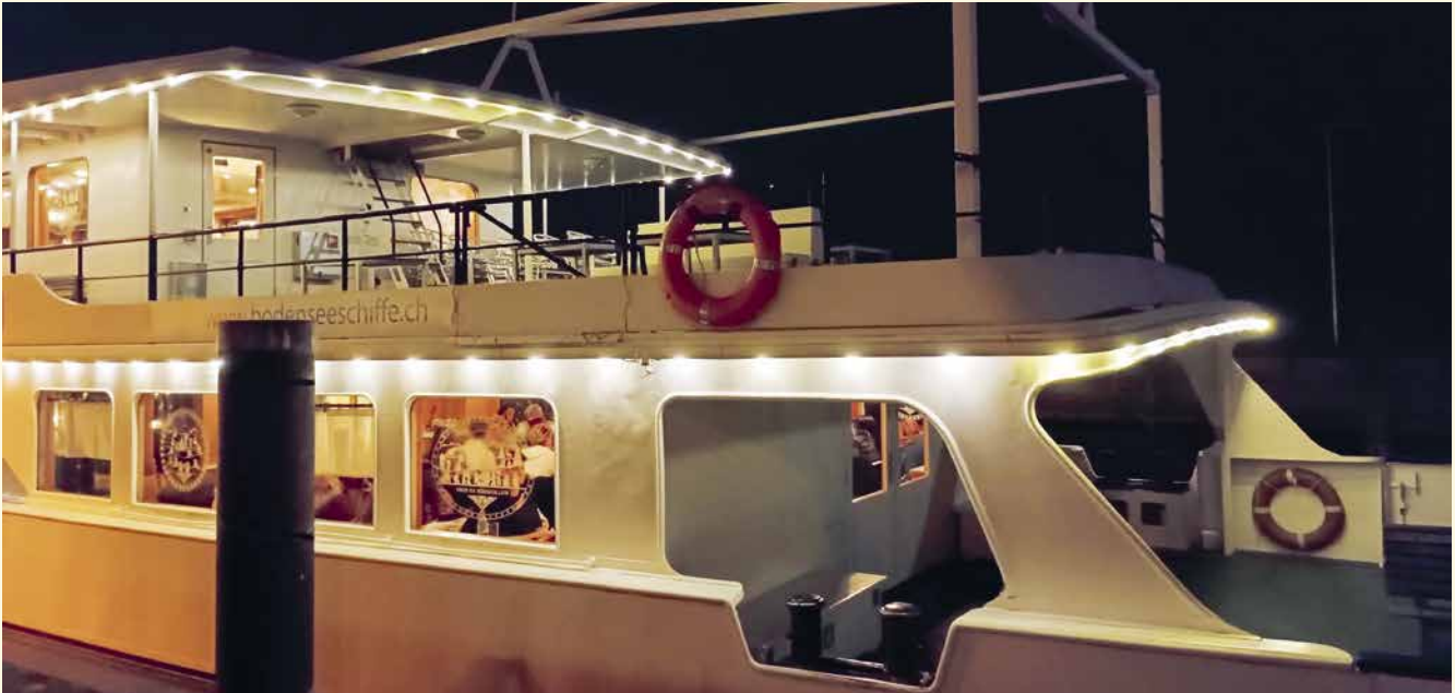
Der Abend klang auf einem Fondueschiff aus.

nautischen Crew reichlich verwöhnt. Nach einem Vorspeisensalat wurden verschiedene Raclettesorten wie Pfeffer-, Chili- und Knoblauchkäse und Fondue Chinoise (Rind, Kalb, Schwein) à discretion serviert und jede Person konnte sich auch am reichhaltigen Beilagenbuffet (Reis, Pommes, Gemüse etc.) bedienen. Während der kurzweiligen Schifffahrt wurden Gespräche über Gott und die Welt geführt und selbstverständlich auch Pfadi-Themen ausgetauscht. Im Hafen von Rorschach angekommen, endete ein lehrreicher Nachmittag bzw. kulinarisch feiner Abend.