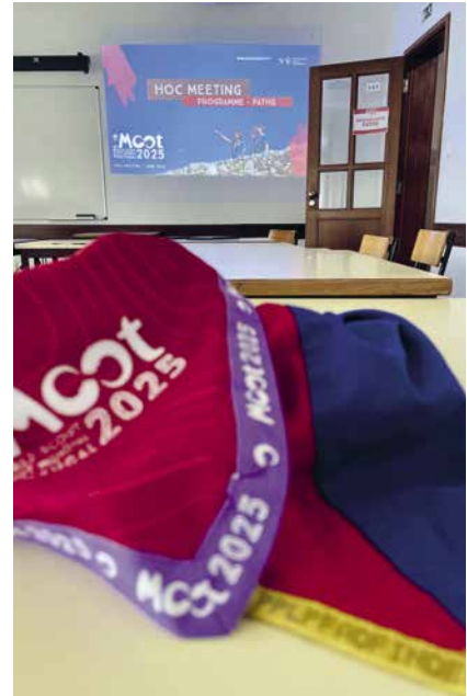
Liechtenstein war präsent am Treffen der Delegationsleiter.