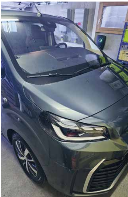
Der neue Elektrobuss passt knapp noch in die Garage des Pfadiheims.