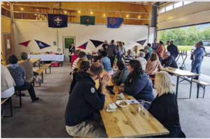
13. Juni 2025, Freitag Ehemaligentreff