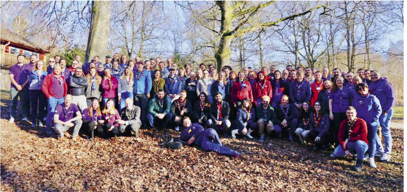
Gruppenfoto der Teilnehmenden des Symposiums 2025 in Höör, Schweden.