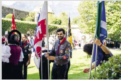
15. August 2025, Freitag Staatsfeiertag