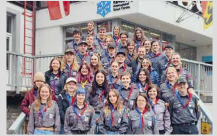
20. April 2025, Sonntag Ausbildungswoche 2025