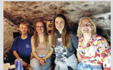
9. Mai 2025, Freitag Pfadibeizle (Abt. Schellenberg)