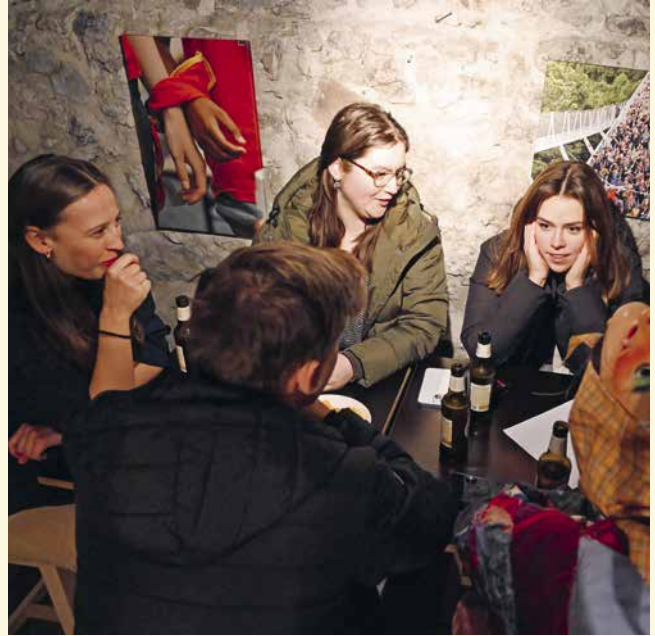
Die Gruppe «D'Besserwösser» aus Schaan berät sich.