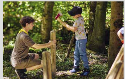
13. September 2025, Samstag Schnuppertag