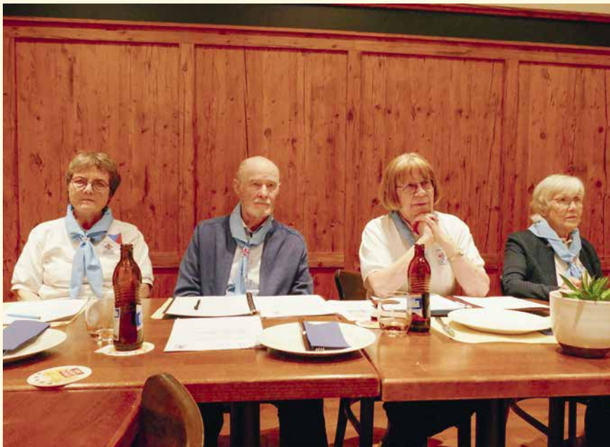
Der Gilderat führte speditiv durch die Generalversammlung.