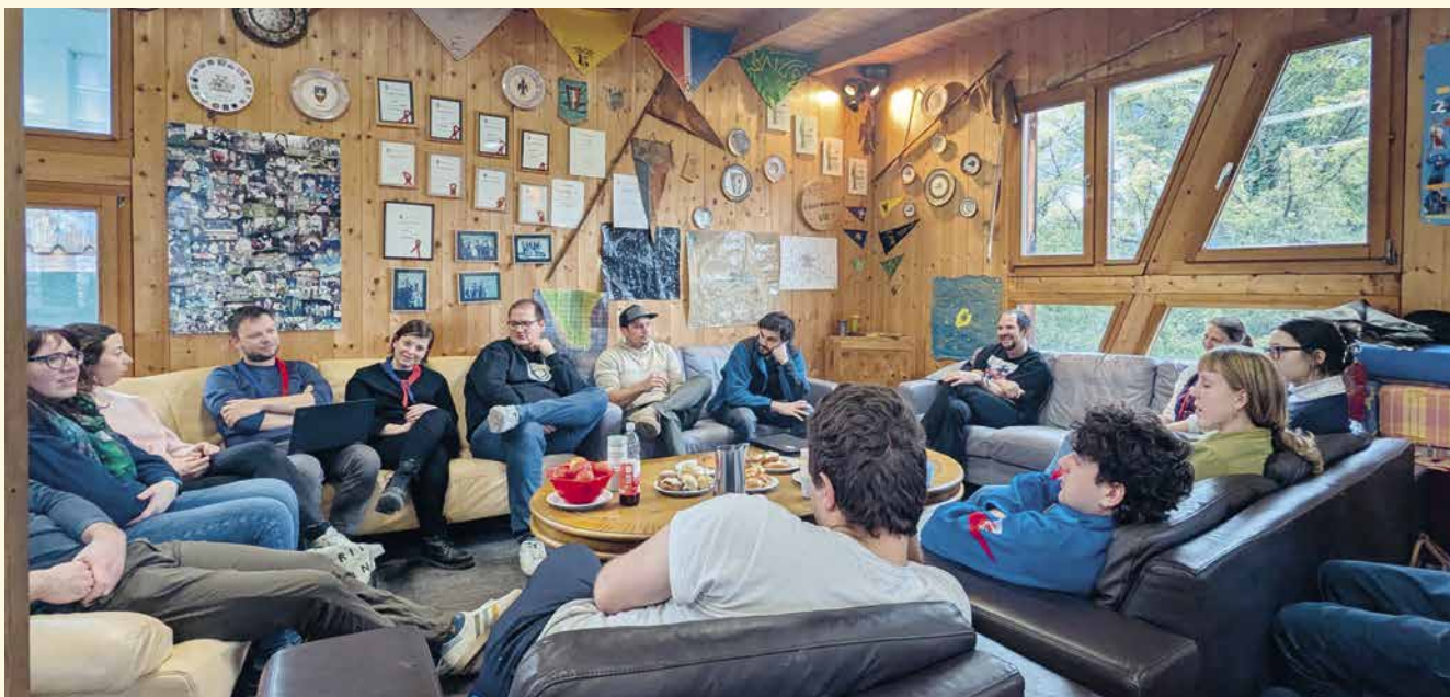
Der Strategietag fand in der Schmetta in Schaan statt.