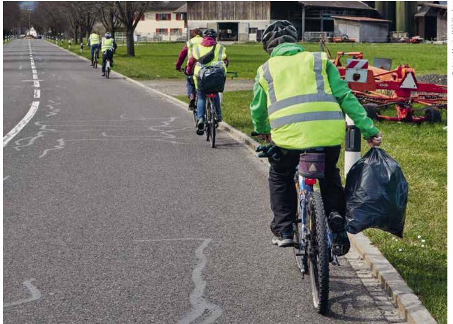
Viele Teilnehmende kamen mit dem Fahrrad zur «Gmondspotzete». Ideal für Einsätze im Riet.