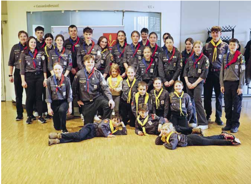
Dem grossen Andrang kam die Abteilung Ruggell mit 30 freiwilligen Helferinnen und Helfern entgegen.