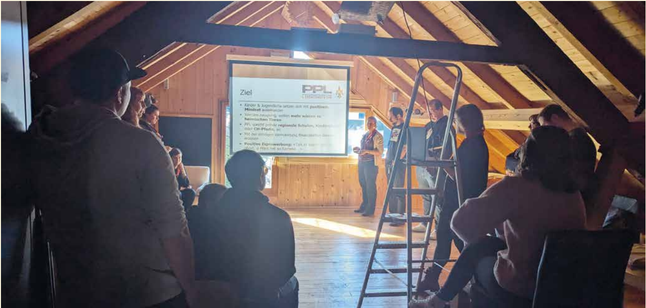
An diesem Samstag wurden allerlei Ideen erarbeitet und diskutiert.

lastung einzelner Personen durch unklare Aufgabenverteilung, Kommunikationsprobleme und teilweise mangelnde Motivation. Auch die Materialverwaltung, die Programme für ältere Stufen und die Unterstützung durch die Gemeinde wurden als Baustellen identifiziert.