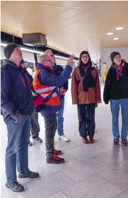
Faszinierte Gesichter während der Führung durch den Hauptbahnhof Zürich.