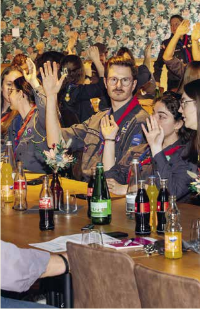
Sämtliche Anträge wurden einstimmig angenommen.