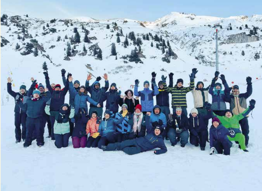
28 Leiter und Leiterinnen traten in vier Gruppen bei Winterspielen gegeneinander an.