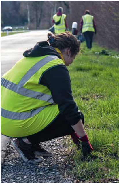
Verpackungen und Zigaretten machten den Grossteil des gefundenen Abfalls aus.