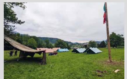
17. Mai 2025, Samstag PPL-Waldtag