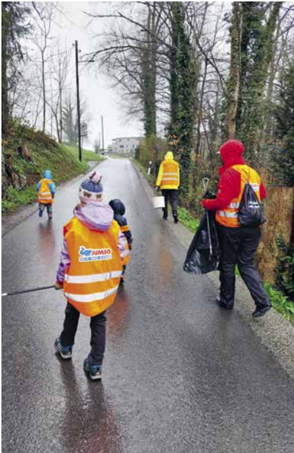
Das Wetter hätte besser sein können bei der «Umweltpotzete».