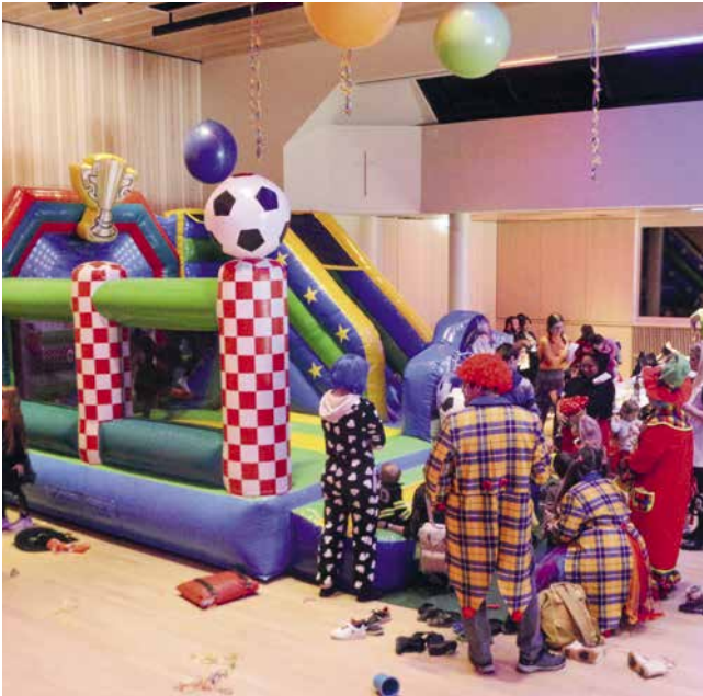
Für die Hüpfburg mussten die Kinder teilweise sogar anstehen.