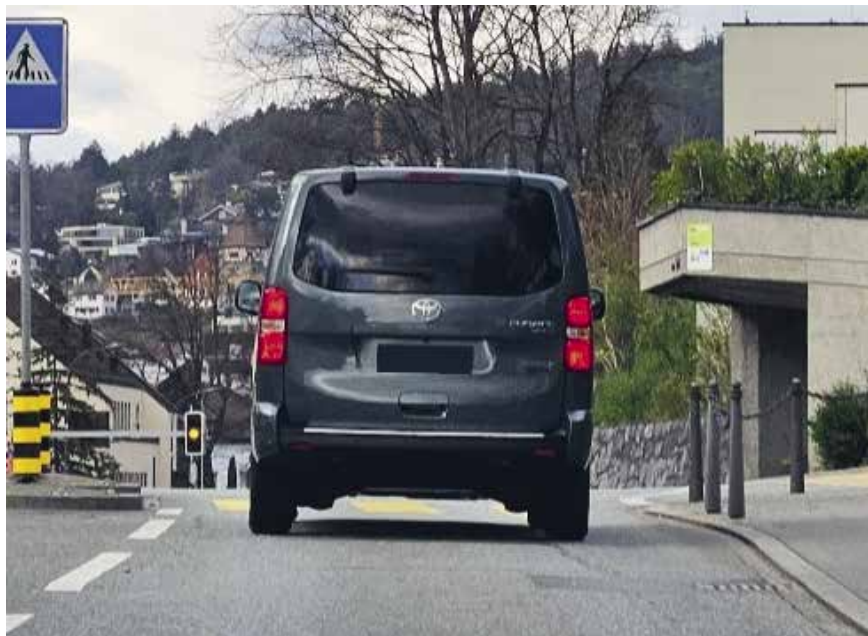
Eine der ersten Fahrten des neuen Elektrobusses der Abteilung Mauren/Schaanwald.