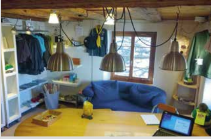
6. Juni 2025, Freitag Scout Shop