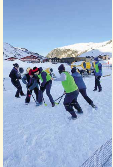
Eine der Disziplinen war Schneehockey.