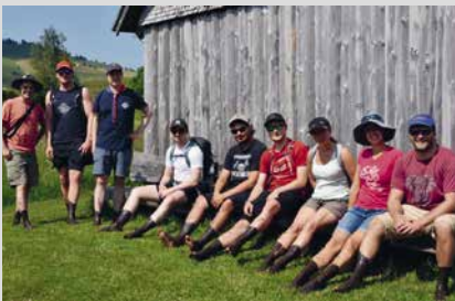
14. Juni 2025, Samstag Landesanstoss 3. und 4. Stufe