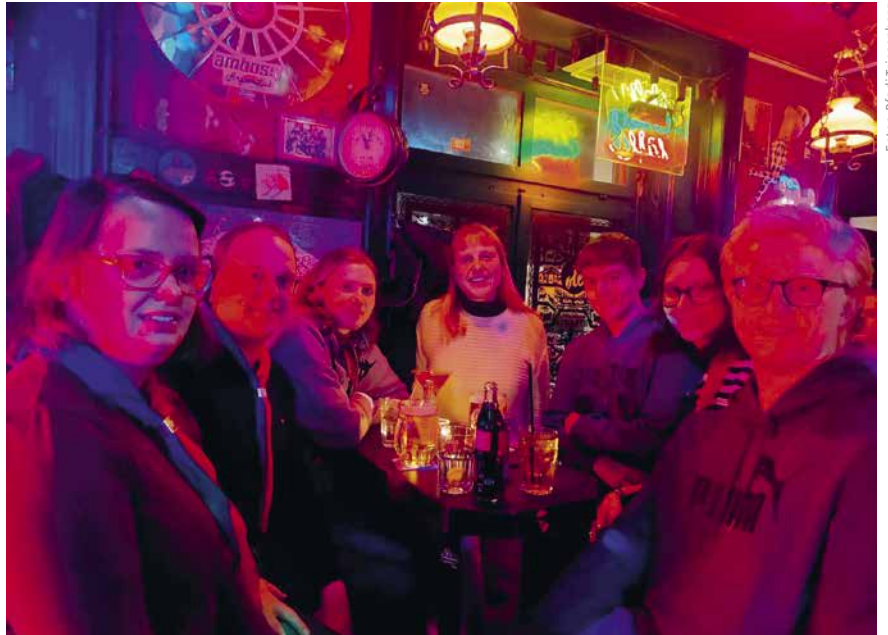
Der krönende Abschluss des Leiterausflugs erfolgte in der Olé Olé Bar.