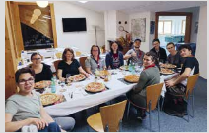
8. September 2025, Montag Landesanstoss 3. und 4. Stufe