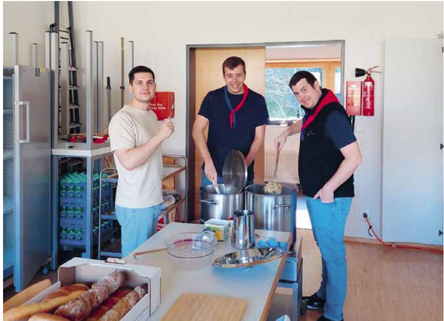
Ein Blick in die Suppenküche des Gampriner Vereinshauses.