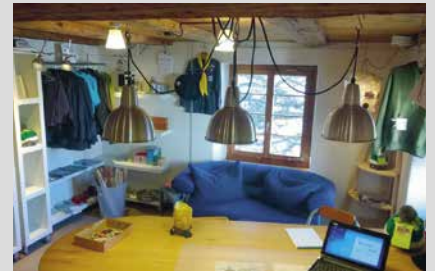
9. Mai 2025, Freitag Scout Shop