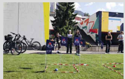
20. September 2025, Samstag Sägässa in Balzers