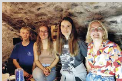
29. August 2025, Freitag Pfadibeizle (Abt. Gamprin)