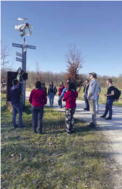
Im Rahmen der DSK gab es auch Ausflüge für die Teilnehmenden.