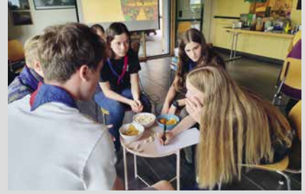
30. August 2025, Samstag Landesanstoss 2. Stufe