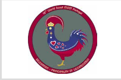
25. Juli 2025, Freitag World Scout Moot in Portugal