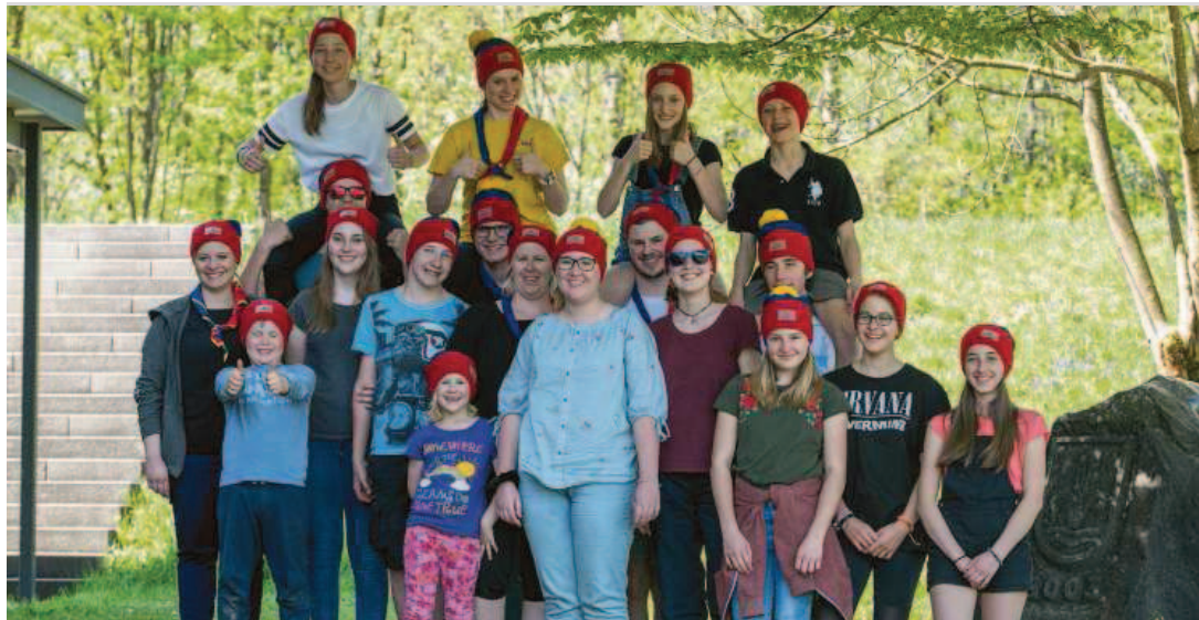
Aus Liechtenstein nehmen 17 Pfadfinderinnen und Pfadfinder am Euro-Mini-Jam auf den Färöer teil.